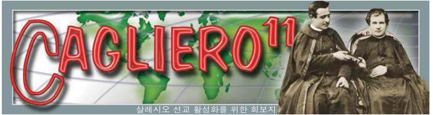
살레시오 선교 활성화를 위한 회보지